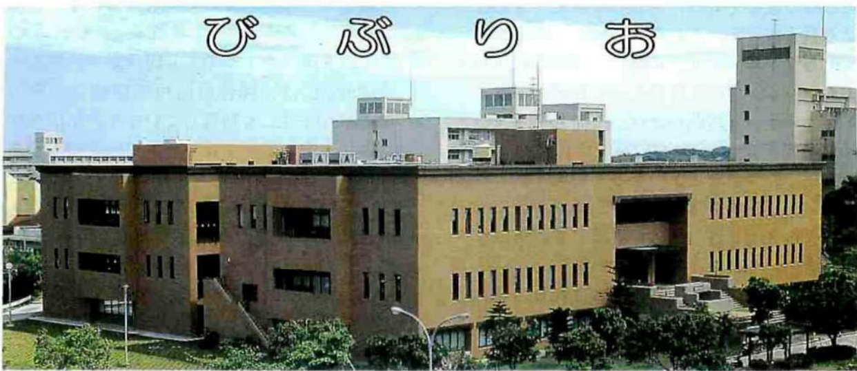
University of the Ryukyus Library Bulletin Vol.28 No.1(No.105) Jan. 1995